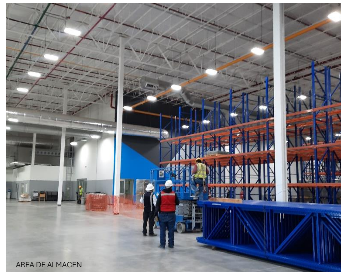
AREA DE ALMACEN